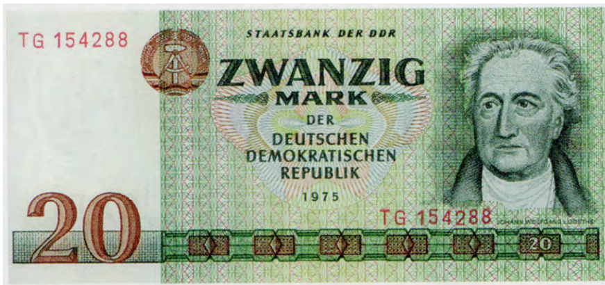
Goethe-Portrat als Geltungszeichen: 20-Mark-Schein der Deutschen Demokratischen Republik von 1975 (A-Seite).

Wir nennen Wahrung, was lange wahrt und worauf wir uns verlassen zu konnen glauben. Wir vertrauen dem Geld, wenn es heute und morgen Geltung hat und Kaufkraft beweist. Geld beziffert den Wert unserer Arbeit als „angemessene“ Entlohnung ebenso wie den Preis der Guter, die wir zum Leben brauchen. Was aber passiert, wenn diese Verlasslichkeit nicht mehr gegeben ist, wenn immer mehr Geld in den Umlauf kommt, das zugleich immer weniger Kaufkraft besitzt? Und was passiert in diesem Fall mit dem Geld selbst, wie verandert es sich in seinem Auftritt, seinem Design?