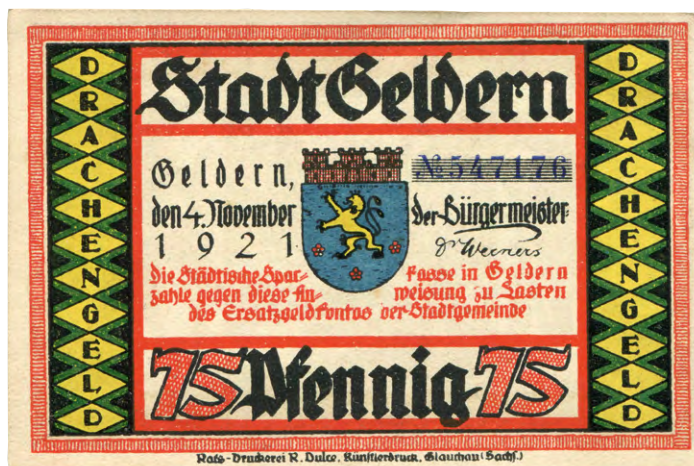
„Drachengeld“ aus Geldern am Niederrhein, das die sich um die Geschichte der Stadtgründung rankende „Drachensage“ erzählt (wiederkehrende A-Seite der aus acht Scheinen bestehenden Serie).

Solcherart Geld gab es in Deutschland flächendeckend, zwischen 1920 und 1922. Man hätte damit bezahlen können, freilich nur in einem sehr begrenzten Gebiet und in einem sehr kleinen Zeitfenster. Das allerdings hat kaum jemand getan, es war dazu einfach zu schön oder zu interessant. Dieses Geld nennt man Seriennotgeld. Davon erzählt dieses Buch.