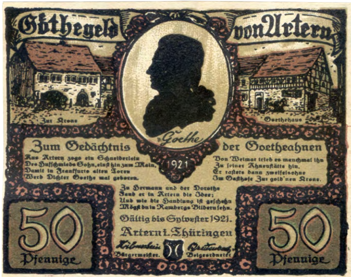
Aus Goethes Aufenthalt im Gasthaus „Krone“ wird 1921 „Goethegeld von Artern“: 50-Pf.-Seriennotgeldschein aus Artern (Unstrut) (wiederkehrende A-Seite einer Serie mit sechs unterschiedlichen Motiven auf der B-Seite).